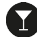
Cocktail 80 p