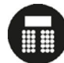
Theater 70 p

Lengte 11m | breedte 8.75m | hoogte 4.24m | oppervlakte 96.25m 2