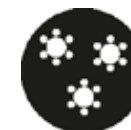
Diner 30 p